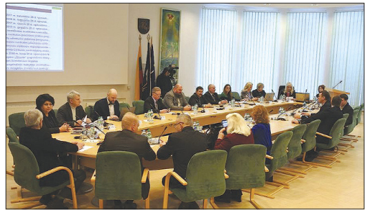
31 января состоялось заседание Совета Висагинского самоуправления. В повестке значился 31 вопрос. В частности, Советом было рассмотрено следующие.

Внесены изменения в систему заработной платы руководителей бюджетных учреждений, изменен порядок распределения и использования средств, выделенных школам Висагинского самоуправления, внесены изменения в ранее утвержденное разрешение количества должностей в Висагинском центре рекреационных услуг. Изменен и ранее утвержденный порядок использования неиспользованных средств денежной социальной поддержки. Утвержден порядок бесплатного питания учащихся в Висагинском самоуправлении и порядок поддержки в приобретении школьных принадлежностей.