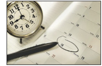
График приема жителей членами Совета

Visagino savivaldybės tarybos narių gyventojų priėmimo asmeniniai klausimai 2018 m. rugsėjo mėn. grafikas (gyventojų priėmimas vyksta Parko g. 14-104).