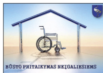
BUSTO PRITAIKYMAS NEIGIAMIESiems

Priėmimo laikas: I-II nuo 8.00 iki 17.00 val., III-IV nuo 8.00 iki 12.00 val., V – neįprėmimo diena, pietų pertrauka nuo 12.00 iki 12.45 val.